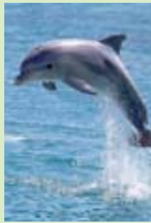
Reserva natural de la región de Saïdia

Al Norte de Marruecos, donde se encuentran el Mediterráneo y el Atlántico existen tres terrenos singulares, que constituyen una experiencia mediterránea. Estos campos de golf son muy frecuentados por jugadores europeos, tanto en verano como en invierno.