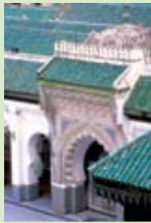
Mezquita Al Quaraouiyine Fez