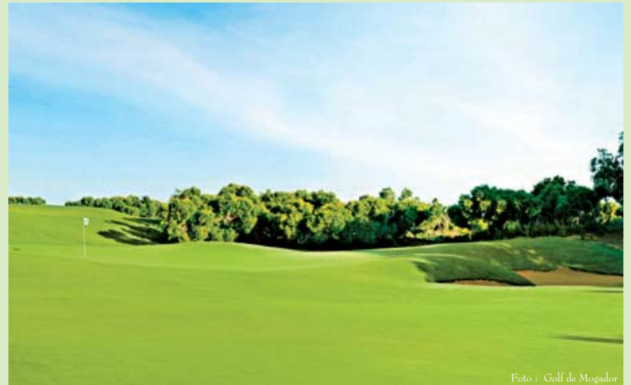
Foto : Golf de Mogador