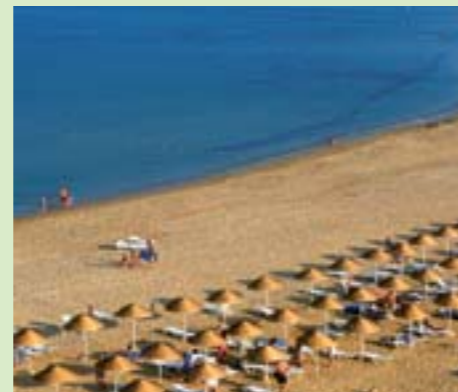
Tetuán Playa de Tamuda Bay