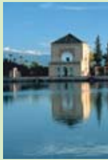
La Menara - Marrakech