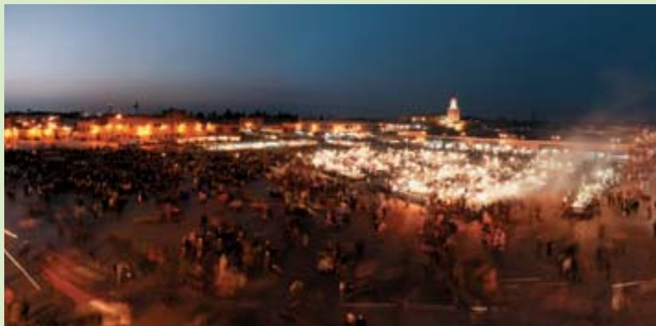
Plaza Jemaa El Fna - Marrakech

Desde la plaza Jemaa-el-Fna, punto neurálgico de Marrakech, Patrimonio Oral de la Humanidad, centro festivo y acogedor, pasando por la visita de los jardines (los jardines de la Menara, el jardín Majorelle para los más conocidos), uno se dejará perder en el laberinto de las alamedas de la medina animada.