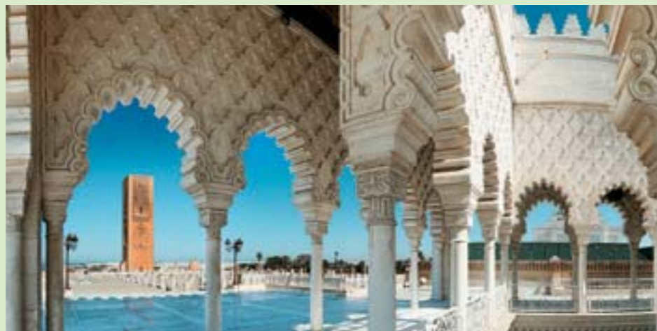
Mausoleo Mohammed V – Rabat

A lo largo de este viaje histórico y esta experiencia cultural, los golfistas encontrarán diez campos de golf, todos ellos construidos en los alrededores de las ciudades marroquíes.